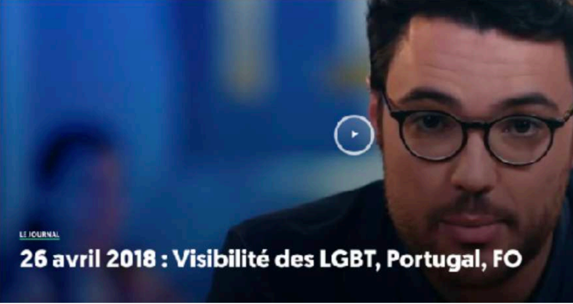
26 avril 2018 : Visibilité des LGBT, Portugal, FO

« Quand j'ai décidé de faire ma transition, j'ai eu ce désir d'enlever le «e». J'ai pris la décision de m'affirmer tel que je suis, un homme trans. »