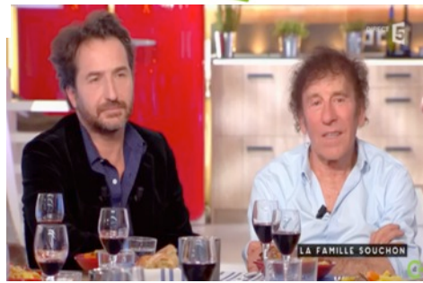
LA FAMILLE SOUCHON