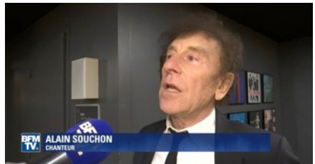
ALAIN SOUCHON CHANTEUR