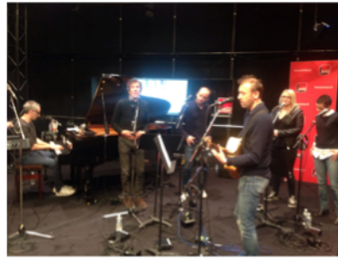
ÉMISSION : FRANCE INTER - LA BANDE ORIGINALE AVEC ALAIN SOUCHON ET PIERRE SOUCHON GALA ALZHEIMER 2016 DATE : 11 FÉVRIER 2016