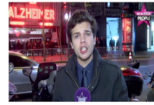
ÉMISSION : NON STOP PEOPLE MARDI 11 FÉVRIER 2016 GALA ALZHEIMER 2016 ALAIN SOUCHON - CARLA BRUNI - NOLWENN LEROY - SANDRINE KIMBERLAN AUDIENCES : 1 973 000 visites uniques par mois