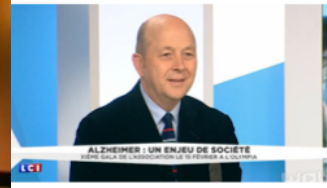
ÉMISSION : CHOISISSEZ VOTRE CAMP - LCI LE VENDREDI 12 FÉVRIER 2016 GALA ALZHEIMER 2016