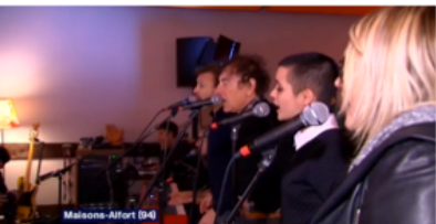
ÉMISSION FRANCE 3 NATIONAL SAMEDI 13 FÉVRIER 2016 RÉPÉTITIONS GÉNÉRALES À MARSON ALFORT GALA ALZHEIMER 2016